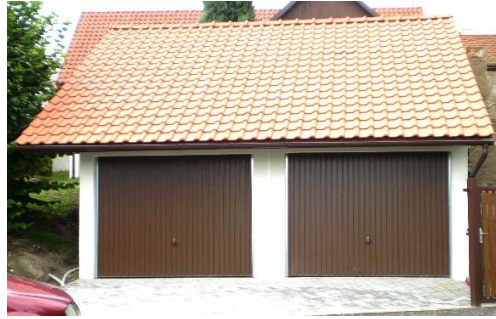
Dvojaráž se sedlovou střechou